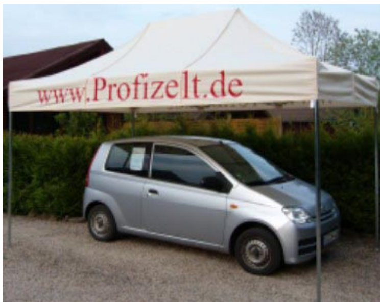
Express-Profi Pavillon 2,7x4,0m Farbe Natur(Beige)