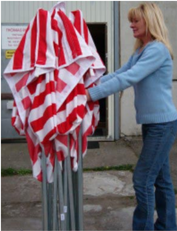
Gestell leicht auseinanderziehen