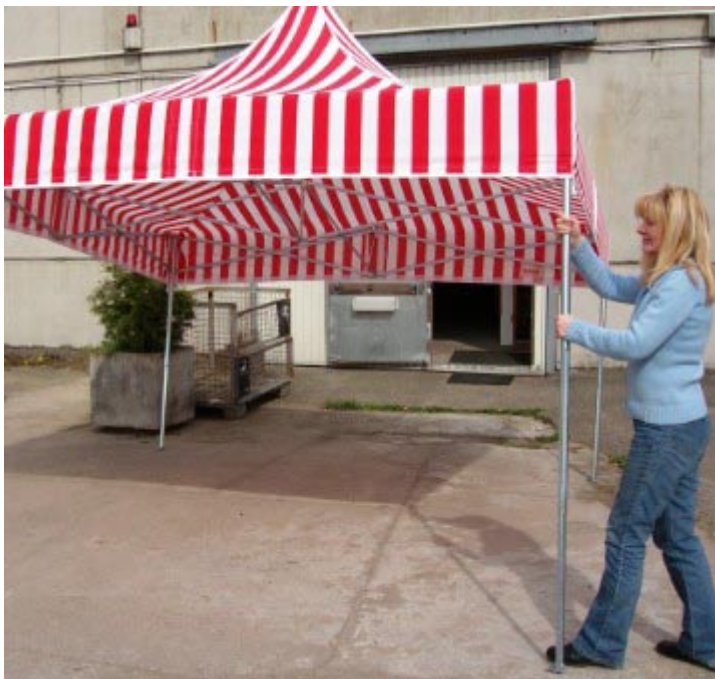
Alle 4 Teleskopstandbeine einrasten