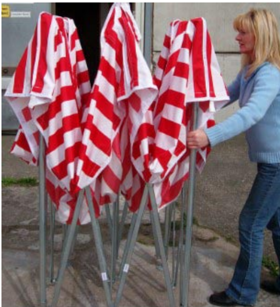
Gestell weiter auseinanderziehen