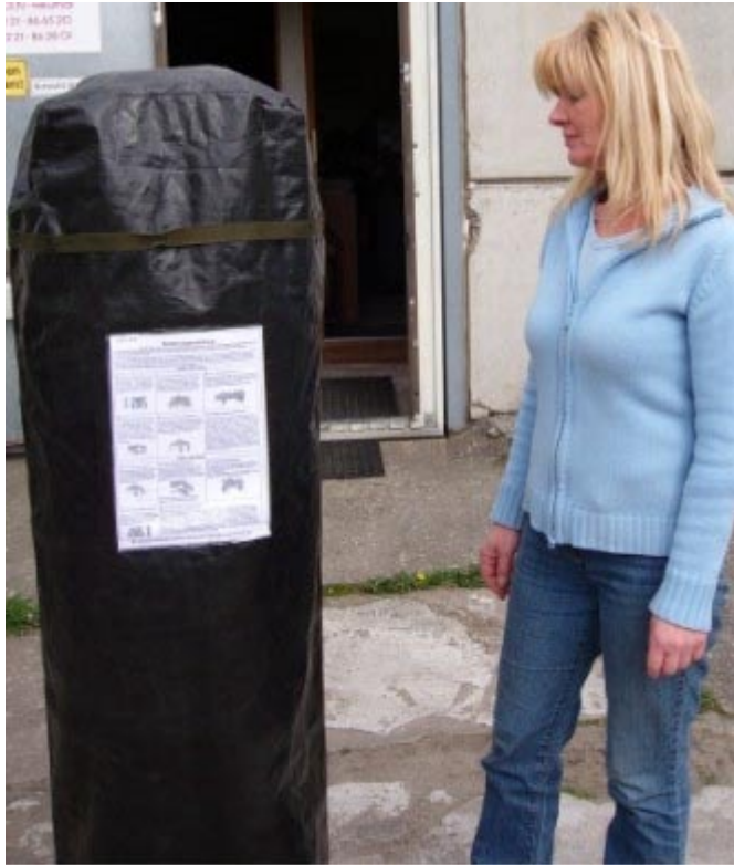
Express-Profi Pavillon mit Schutzhülle

Express-Profi Pavillon für den gewerblichen Einsatz