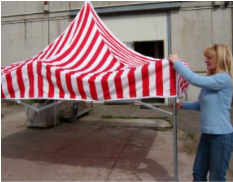
4 Ecken einrasten lassen