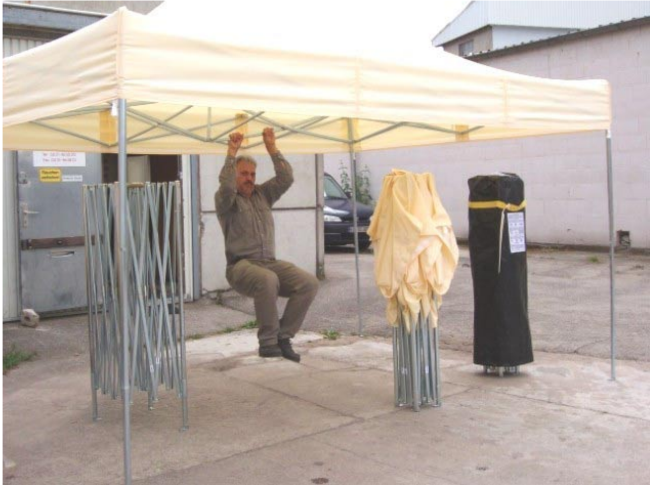
Express-Profi Pavillon - Alle Streben stark belastbar - 2,7x4,0m Farbe Natur(Beige)